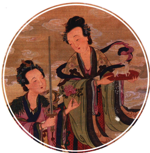
北京白云观藏清代水陆画 擎羊陀罗使者