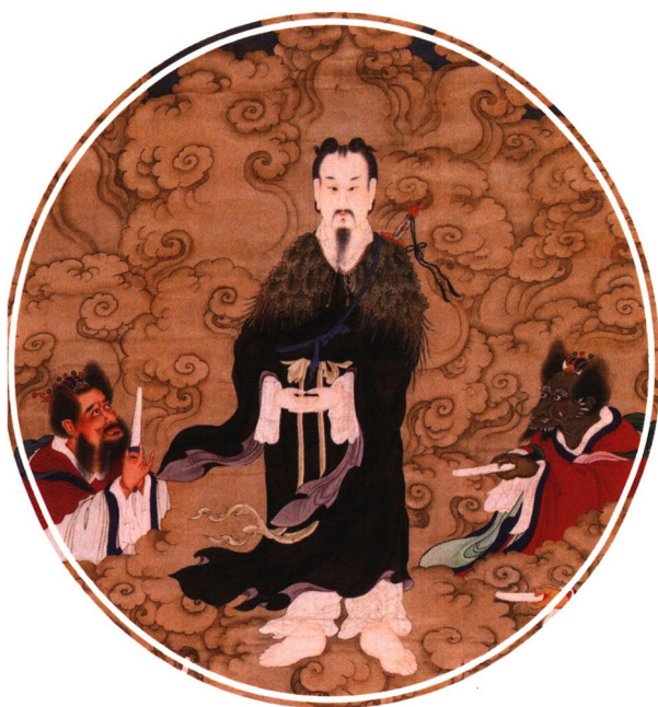
北京白云观藏清代水陆画 赤脚大仙