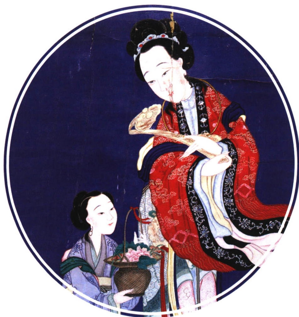
北京白云观藏清代水陆画 仙姑降祥