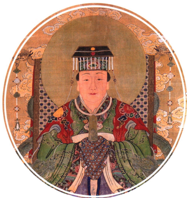
北京白云观藏清代水陆画 后土像