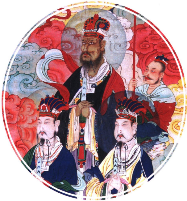
北京白云观藏清代水陆画 三官像