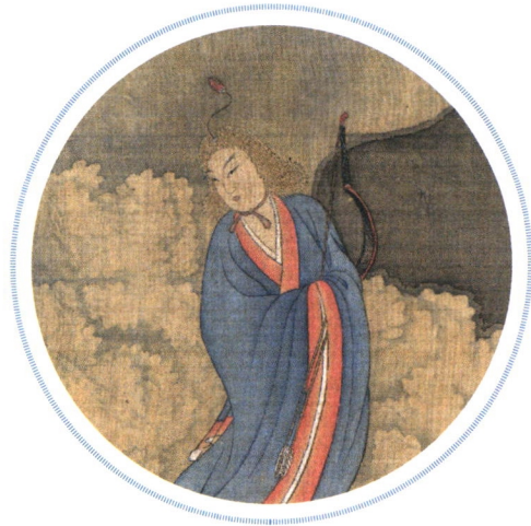
北宋 张敦礼 九歌图卷（局部）