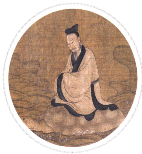
北宋 张敦礼 九歌图卷（局部）