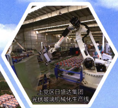
上党区日盛达集团光伏玻璃机械化生产线