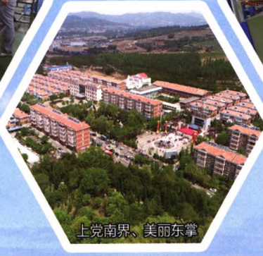
上党南界、美丽东掌