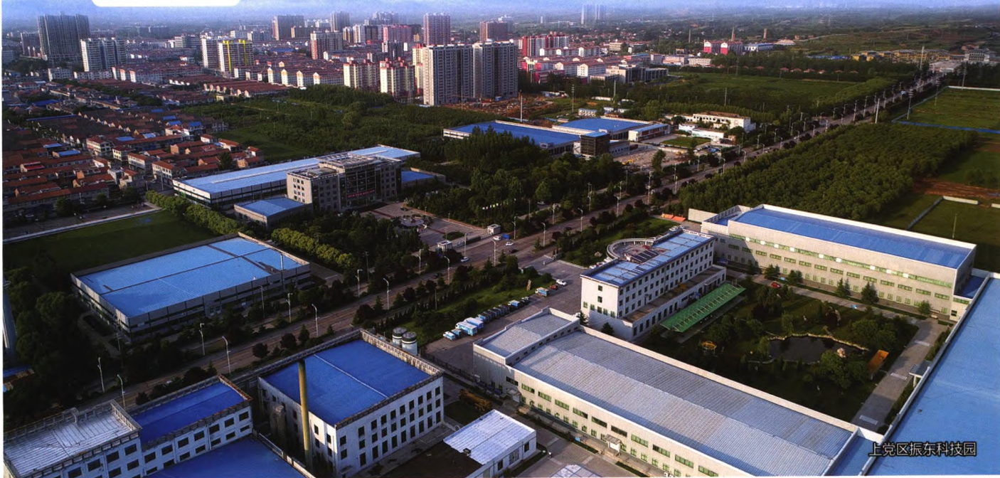
上党区振东科技园

国内统一刊号 CN11-3331/D 国内邮发代号 2-9 单册定价 20.00元