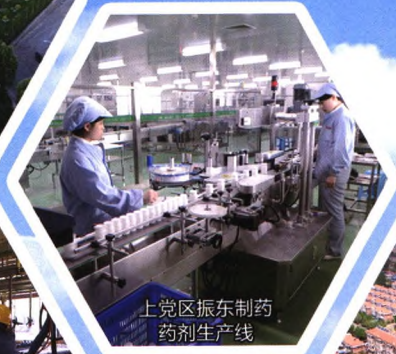
上党区振东制药药剂生产线