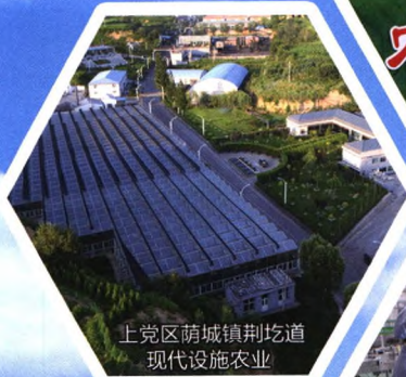
上党区荫城镇荆圪道现代设施农业