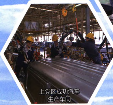
上党区成功汽车生产车间