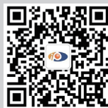
微信公众平台二维码