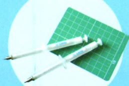
· DB-101手动打孔器 ·