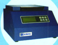
· DB-R48恒温热块 ·