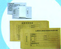
· DNA血样采集卡 ·

DB-80全自动核酸提取仪，在20分钟内快速的获取高质量DNA，实验操作简单、快捷。即使疑难和微量的生物检材也可提取出高质量的DNA。