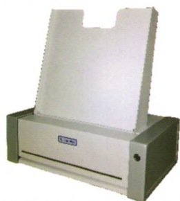
单张送片经济型机型