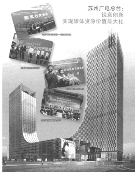
苏州广电总台: 锐意创新 实现媒体资源价值最大化