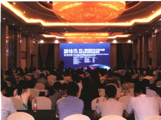
连续28年组织国际果蔬汁加工技术论坛

地址：（西院）山东省济南市燕子山小区东路24号（250014） （东院）山东省济南市经十东路16001号（250220） 电话：13964062861；13011717715 邮箱：fataohe@163.com；ianzhao@live.cn 网址：www.ctcf.top