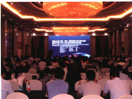
连续28年组织国际果蔬汁加工技术论坛

地址：（西院）山东省济南市燕子山小区东路24号（250014） （东院）山东省济南市经十东路16001号（250220） 电话：13964062861；13011717715 邮箱：fataohe@163.com；ianzhao@live.cn 网址：www.ctcf.top