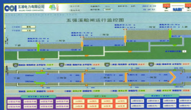
五强溪船闸运行监控图

电话：025-81085810 传真：025-81085888 地址：南京市江宁区诚信大道19号 邮编：211106 网址： http://www.sgepri.sgcc.com.cn