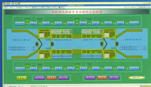
华能湖南湘祁水电站船闸监控图