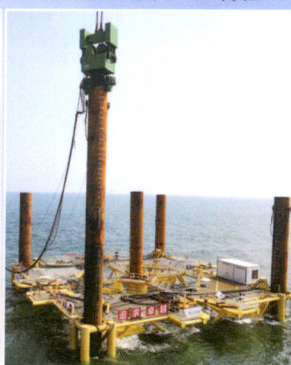
EP800南鹏岛中广核海上风电