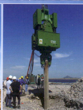
振动冲击成孔做桩