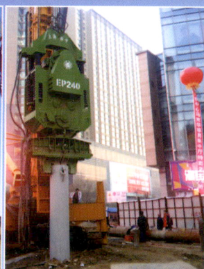
呼和浩特双套管工法