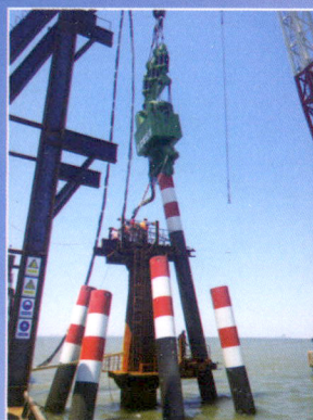
海洋生物监测平台斜桩