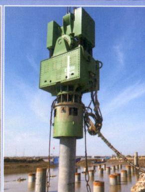
天津沉大直径PHC管桩