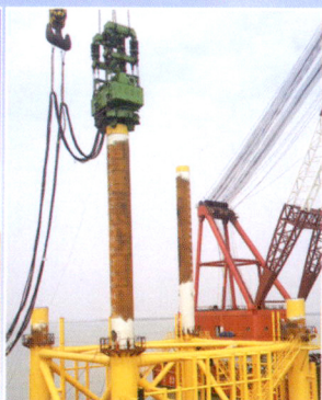
江苏如东华能海上风电