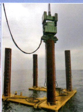
EP1100南鹏岛中广核海上风电