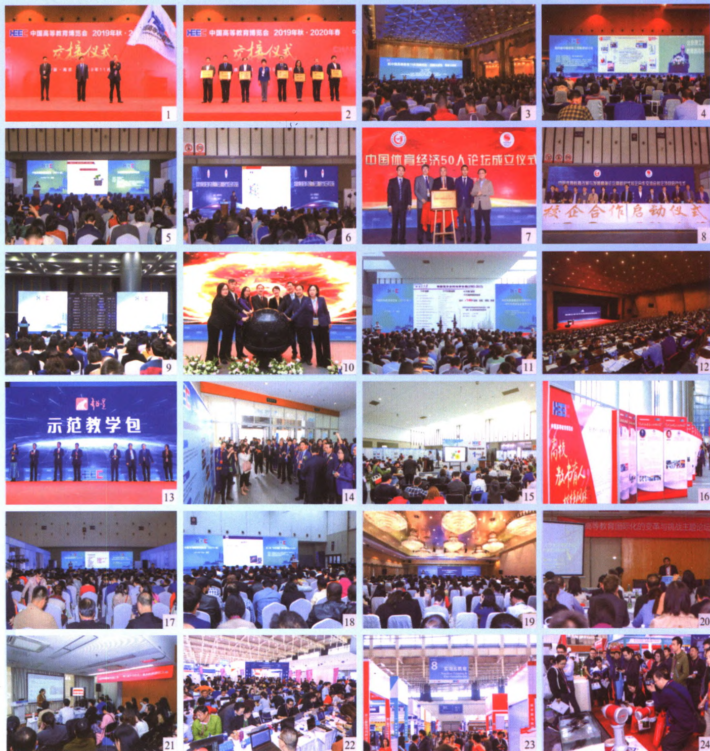
1. 交接仪式现场。2. 颁奖现场。3. 新中国高等教育70年高峰论坛。4. 第四届中国高等工程教育研讨会。5. 区域高等教育改革与发展论坛。6. 中国体育教育改革与发展高端论坛。7. 中国体育经济50人论坛成立仪式。8. 体育论坛校企合作启动仪式。9. 教师教学发展与创新人才培养论坛。10. “高校学生竞赛与教师发展数据平台”上线仪式。11. 高校实验室建设与发展论坛。12. 第三届中国高等教育智慧教学与课堂教学改革高峰论坛。13. 超星示范教学包发布现场。14. “校企合作 双百计划”案例展。15. “校企合作 双百计划”案例路演现场。16. 高校教书育人楷模风采展。17. 新工科背景下人工智能、机器人、智能制造领域学科发展与人才培养论坛。18. 第二届“学在中国”来华留学博士生论坛。19. 第二届中国高校创新发展论坛。20. 商科高等教育国际化的变革与挑战主题论坛。21. 全国高校教师教学创新大赛——第五届外语微课大赛决赛现场。22. 全国高校教师教学创新大赛3D/VR/AR数字化虚拟仿真主题赛项决赛现场。23-24. 展馆现场。