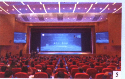
1. 学会会长杜玉波作工作报告。2. 学会副会长张大明主持会议。3. 学会副会长、秘书长姜恩来作财务报告。4. 现场表决。5. 理事会现场。

中国高等教育学会第七届理事会第九次会议于11月20日在郑州举行。中国高等教育学会会长、教育部原党组副书记、副部长杜玉波出席会议并作工作报告。学会副会长刘川生、姜斯宪、李元元、王树国、韩进、罗俊、张炜、刘炯天、姜恩来，监事长孙维杰出席会议，学会副秘书长王小梅参加会议。会议由学会副会长、教育部高等教育司原司长张大良主持。