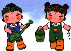
2019北京世园会会徽“长城之花”