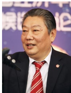
中航工业董事长 林左鸣