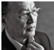
联想集团董事局 名誉主席柳传志