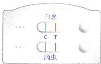
白色念珠菌/阴道毛滴虫抗原二联检测试剂盒卡