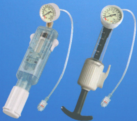
医用球囊扩张压力泵