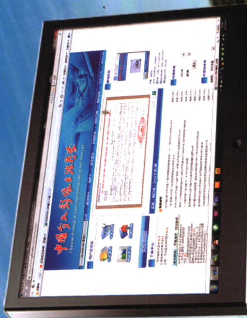
《中国介入影像与治疗学》 www.cjiit.com