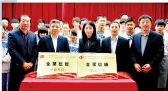
丰职中心校与中国全聚德（集团）股份有限公司合作办学