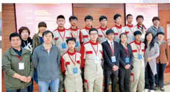
丰职中心校汽车运用与维修专业在北京市专业技能比赛中多次获奖