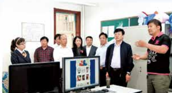
教育部职成司相关领导参观丰职中心校校企合作“远雷动漫工作室”