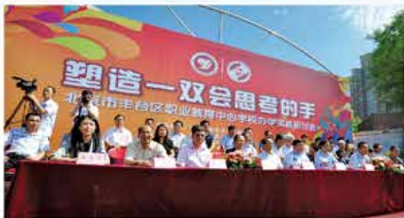
北京市丰台区职业教育中心学校办学实践研讨会

学校将9个校区规划形成现代服务产业、文化创意产业、信息技术产业、教育类和涉农类等五大特色品牌专业功能区，形成“1校区1品牌1基地1中心”的建设格局。坚持“塑造一双会思考的手”的办学理念和“立足经济，服务民生，彰显特色，优质立校”的办学思路，围绕“成为首都技能型人才培养旗舰”的发展愿景，落实“特色鲜明、质量过硬、优势明显的改革发展示范校”建设目标，着力营造“厚德精工”的文化氛围，搭建“全程立体”校企合作平台、“工学结合”学生成长平台、“四级定位”教师培养平台、“教产一体”实习实训平台、“双培共育”国际合作平台，凸显学校社会服务功能。