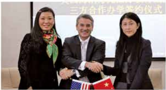
丰职中心校与美国马林社区学院合作办学