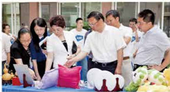
丰职中心校开发的宛平旅游纪念品得到丰台区领导肯定