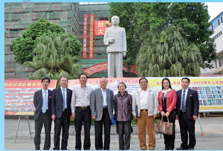
周总理侄女周秉德女士、总理侍卫长高振普将军和总理生前机要秘书纪东将军莅临我校作周恩来精神主题报告