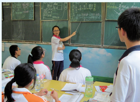
分层导学 精彩课堂