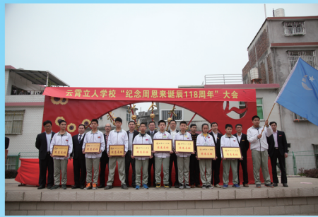
“周恩来班”授旗授牌仪式