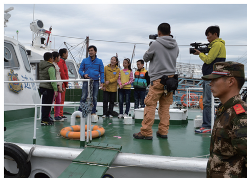
学生参加中央电视台少儿频道节目录制