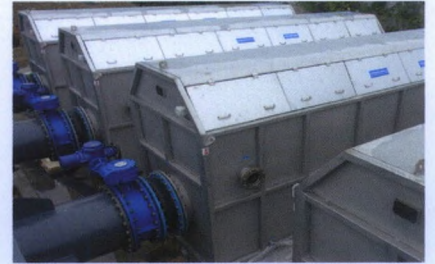
转鼓式精密过滤器