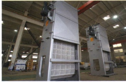
内进流网板格栅除污机（金属/非金属网板）

HC型旋转式固液分离机 HZG-I型转鼓式格栅 HZG-II型转鼓式格栅 HL型旋转式粗格栅清污机 HGS型钢丝绳格栅清污机 HYD型移动式抓斗格栅除污机 HCF型内进流网板格栅除污机