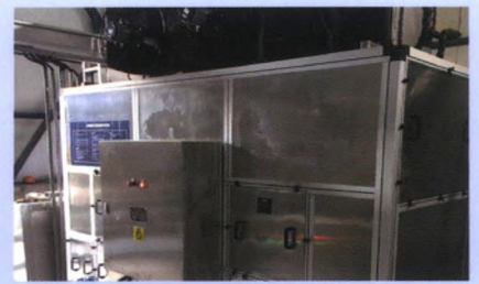
热泵污泥低温带式干化机