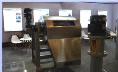
磁混凝高速沉淀池工艺设备