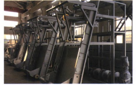
钢丝绳格栅除污机