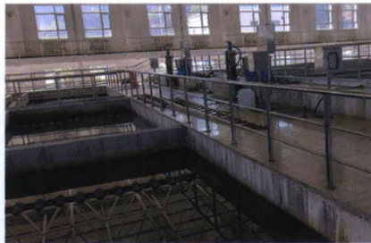
液压往复水下刮泥机