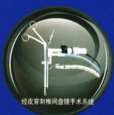
经皮穿刺椎间盘镜手术系统