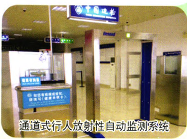
通道式行人放射性自动监测系统