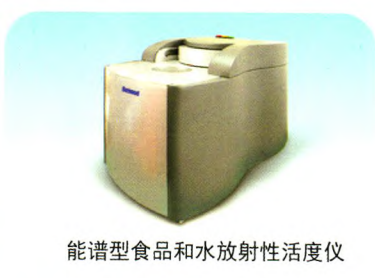
能谱型食品和水放射性活度仪