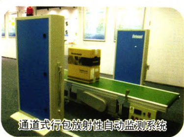
通道式行包放射性自动监测系统