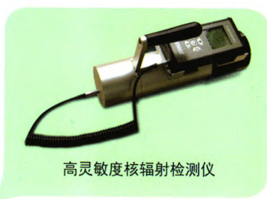
高灵敏度核辐射检测仪