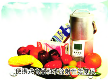
便携式食品和水放射性活度仪