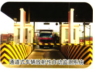
通道式车辆放射性自动监测系统