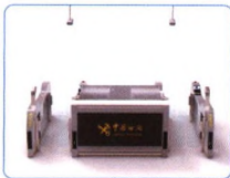
卫检多功能智能查验台