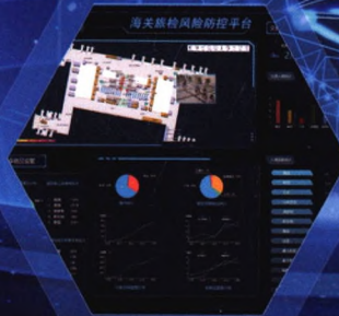
海关旅检风险防控平台