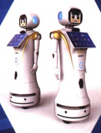
海关智能服务机器人