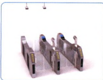
卫检自助查验系统