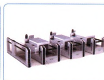
智能手提行李查验系统