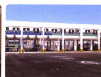
车辆“一站式”验放系统