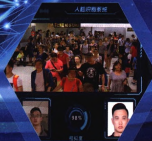
海关动态人脸识别系统