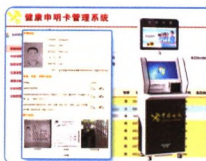
海关旅检自助申报系统 智能申报识别系统