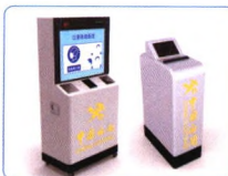
口罩自助配发器 卡片收集识别仪