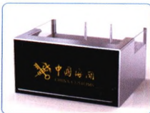
卫检咨询工作台、 综合查验台、督导台