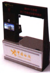
海关旅检智能查验台