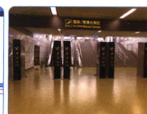
通道式行人核辐射 监测识别系统