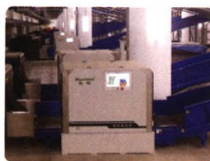
行李预检与风险拦截系统