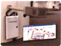
微小气候监测系统