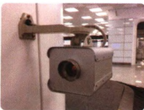
化学毒气监测系统