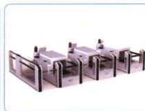
智能手提行李查验系统