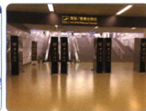
通道式行人核辐射 监测识别系统