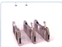
卫检自助查验系统