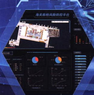
海关旅检风险防控平台