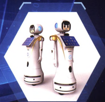
海关智能服务机器人