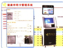
海关旅检自助申报系统 智能申报识别系统