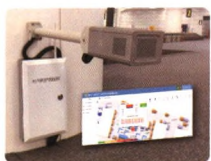
微小气候监测系统