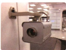
化学毒气监测系统