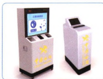
口罩自助配发器 卡片收集识别仪