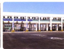
车辆“一站式”验放系统