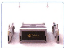
卫检多功能智能查验台