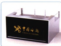
卫检咨询工作台、 综合查验台、督导台