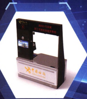
海关旅检智能查验台