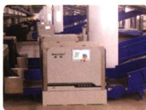
行李预检与风险拦截系统