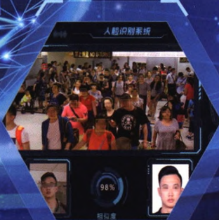
海关动态人脸识别系统