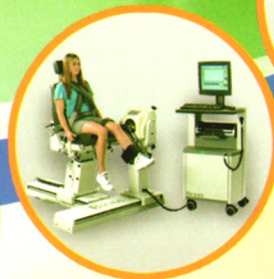
等速肌力评估训练系统