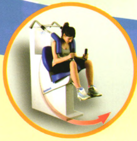
半圆轨腰背肌训练器