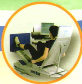
下肢蹬踏弹力训练器