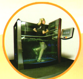
电动步行训练浴槽