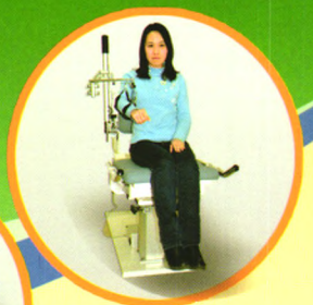
本体感觉测试系统