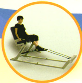
下肢屈伸弹力训练器