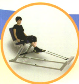
下肢屈伸弹力训练器