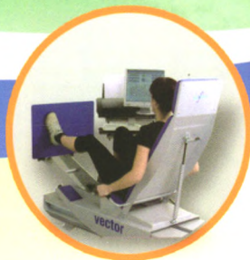
等速肌力评估训练系统