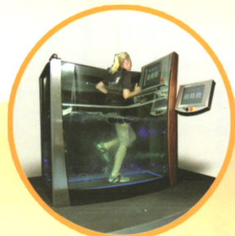
电动步行训练浴槽

北京三捷公司主营进口康复理疗设备和运动生物力学设备，是日本OG、英国HYDROPHYSIO、意大利EASYTECH、德国ZIMMER等公司产品中国总代理。为国内千余家医疗机构、高等院校和科研机构提供了国际先进设备，协助用户制定康复中心建设规划、引进专业人才和开展国内外研修交流。