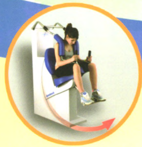
半圆轨腰背肌训练器