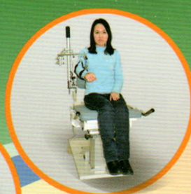
本体感觉测试系统