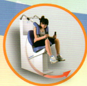
半圆轨腰背肌训练器