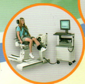
等速肌力评估训练系统