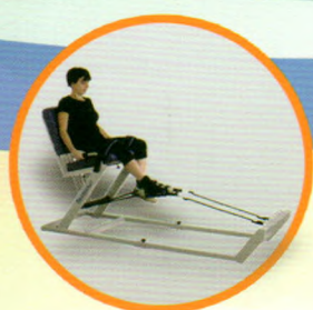
下肢屈伸弹力训练器