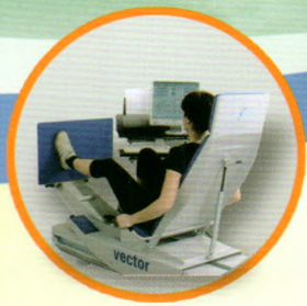
下肢蹬踏弹力训练器