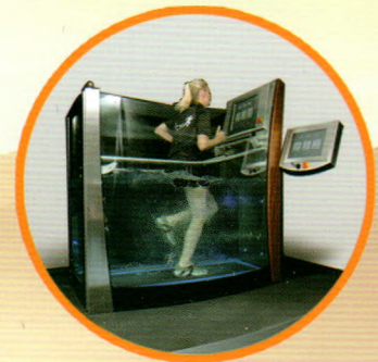
电动步行训练浴槽