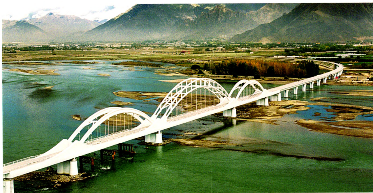
由铁道第三勘察设计院集团有限公司设计的拉萨河特大桥成为青藏铁路标志性建筑（见内文P58）