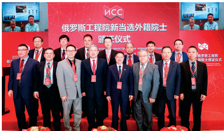
2022年俄罗斯工程院新当选外籍院士颁证仪式

本刊已被“中国知网”“万方数据——数字化期刊群”“中文科技期刊数据库”全文收录。文章凡经本刊使用，如无电子版、有声版方面的特殊声明，即视作者同意授权本刊及与本刊合作的媒体进行信息网络传播与发行。