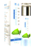
原点种植牙护理液