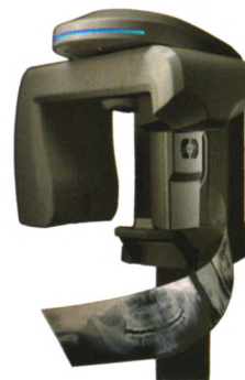
X-era Smart 全景影像设备