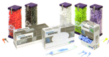
一次性三用喷枪喷头