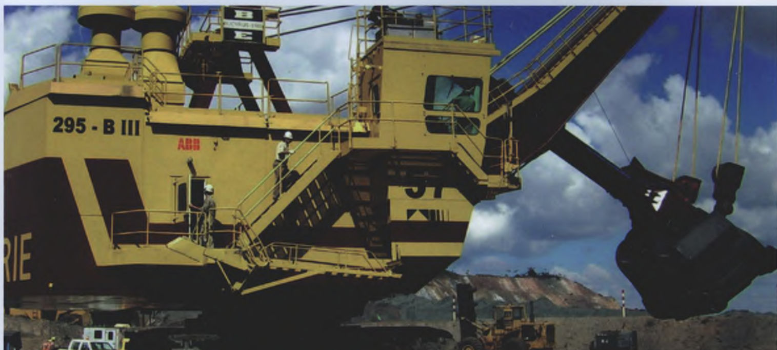
ABB 露天采矿解决方案