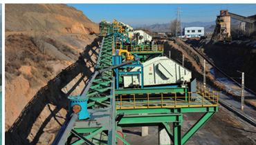
尾矿干排系统应用现场