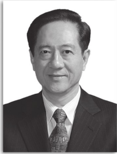
主 编 韩启德 院士 常务副主编 单爱莲