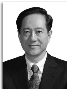
主 编 韩启德 院士 常务副主编 单爱莲