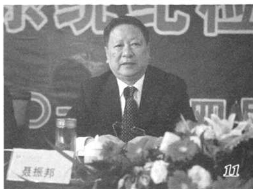
4月8日,全国粮食系统纪检监察工作会议在江苏省南京市召开。