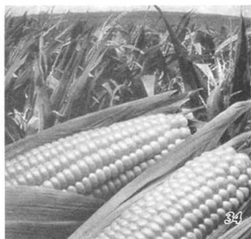
3月份,由于西南5省区旱情持续发展,旱区夏粮减产已成定局,市场看涨预期增强。