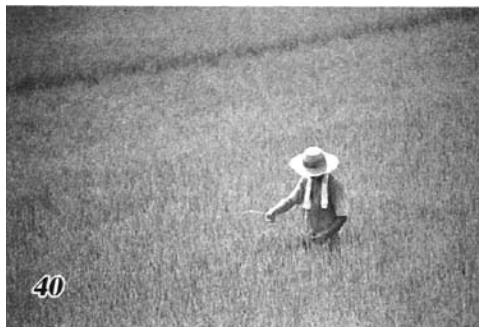
台湾全岛总面积 36 万平方公里，岛内现有 2300 万左右人口，耕地面积近年来稳定在 84 万公顷左右。