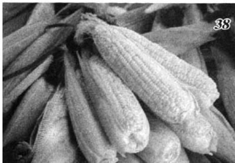
经过上半年持续上涨，目前国内玉米价格已处于历史相对高位。