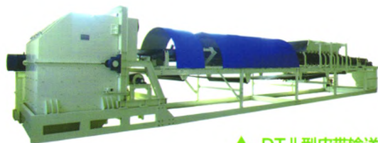
▲ DT II型皮带输送机