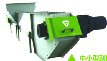
▲ 中小型刮板机系列