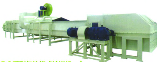
DQ系列气垫带式输送机 ▲