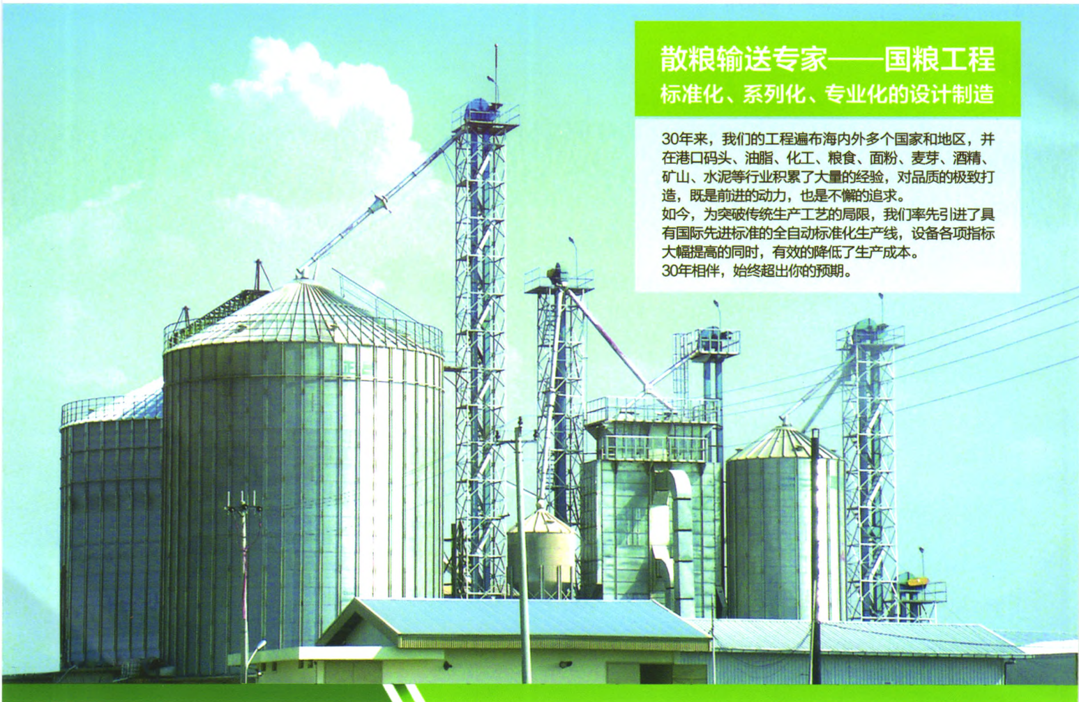
▼ TDTG系列快（慢）速斗式提升机

30年来，我们的工程遍布海内外多个国家和地区，并在港口码头、油脂、化工、粮食、面粉、麦芽、酒精、矿山、水泥等行业积累了大量的经验，对品质的极致打造，既是前进的动力，也是不懈的追求。如今，为突破传统生产工艺的局限，我们率先引进了具有国际先进标准的全自动标准化生产线，设备各项指标大幅提高的同时，有效的降低了生产成本。30年相伴，始终超出你的预期。