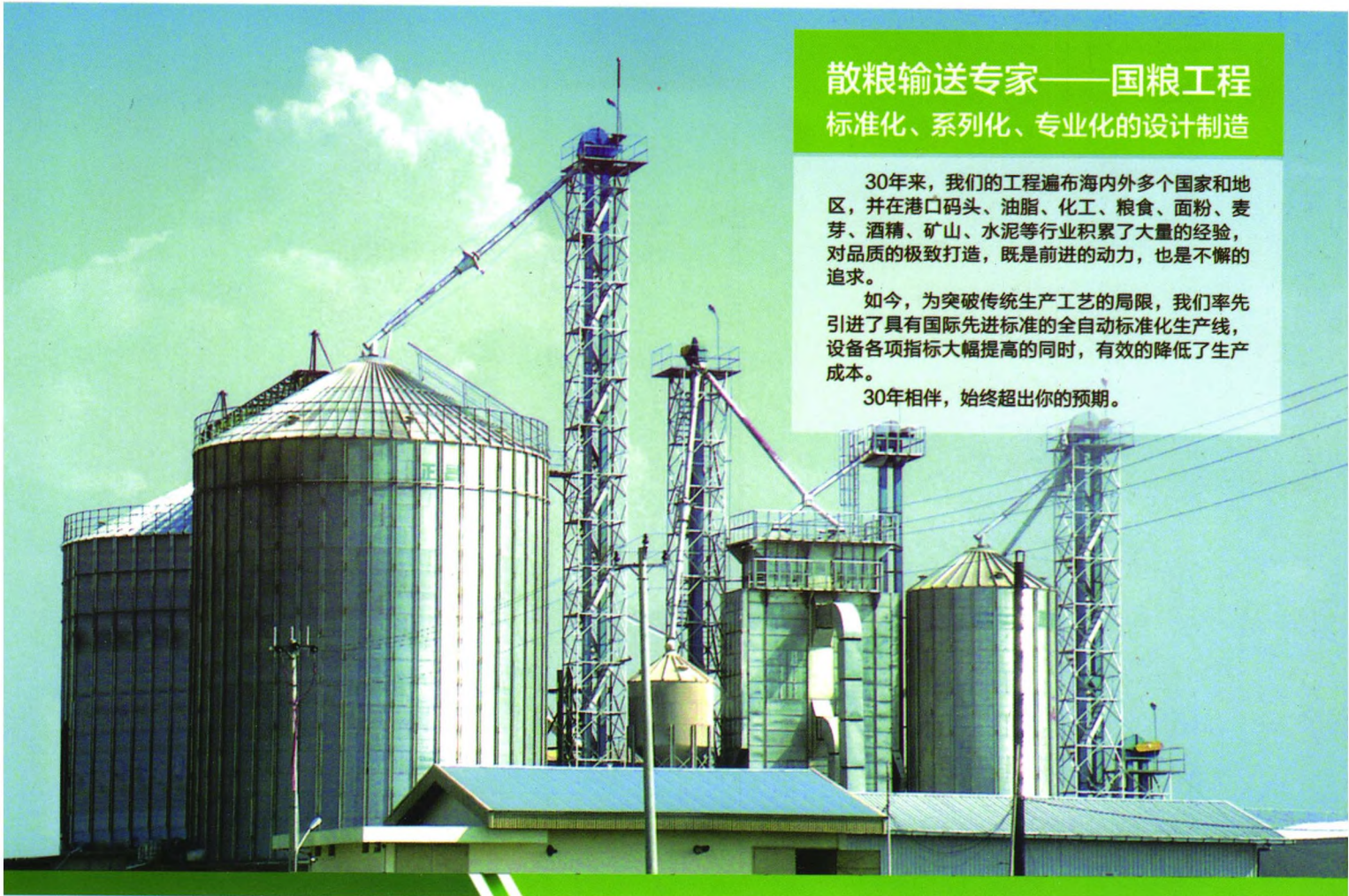
▼ TDTG系列快(慢)速斗式提升机