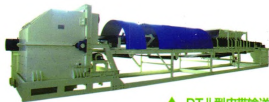
▲ DT II 型皮带输送机