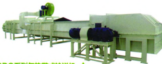
DDQ系列气垫带式输送机 ▲