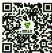
扫描二维码，了解国粮更多