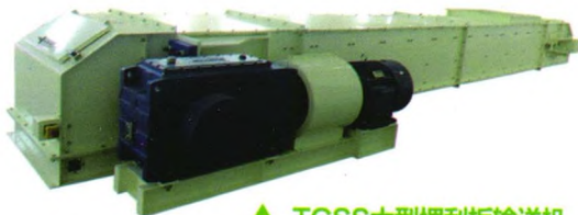
▲ TGSS大型埋刮板输送机