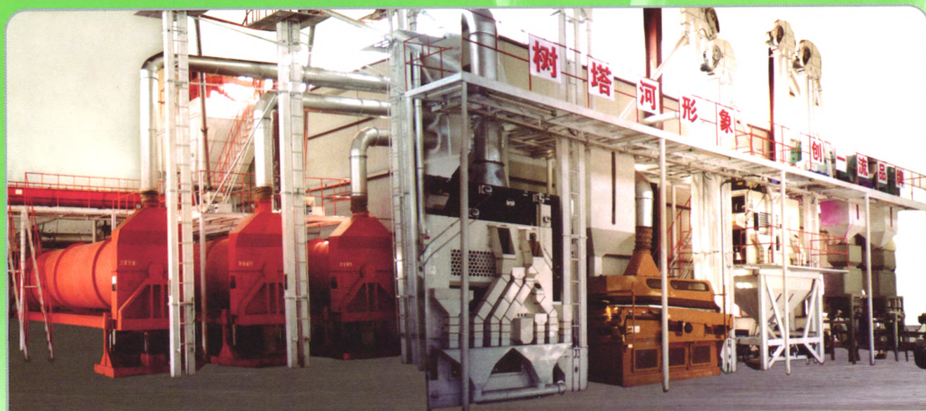
由我公司设计制造安装的塔河种业金银川种子加工厂棉种设备

6项，自治区、兵团科技计划项目12项，地方科技计划项目15项。产品在新疆市场占有70%的份额，并出口到土库曼斯坦和塔吉克斯坦。