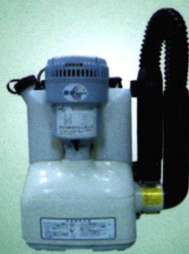
B-ULV-616A 背负式蓄电池 超低量喷雾机