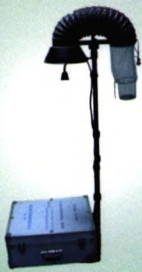
WJ-C 全自动高效蚊虫采样器