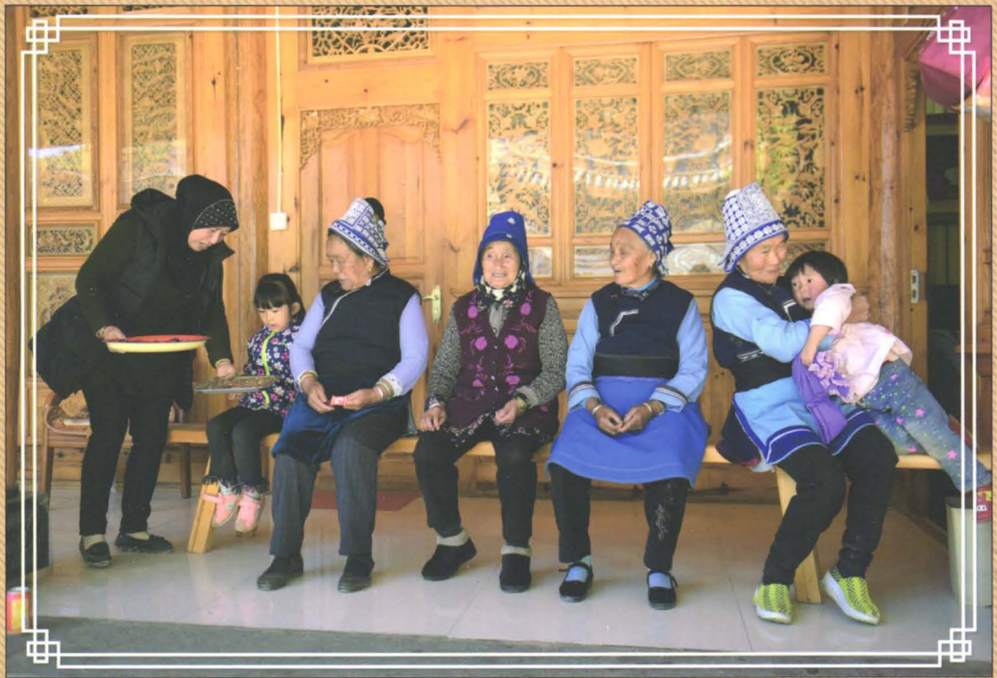
云南大理白回的天伦之乐