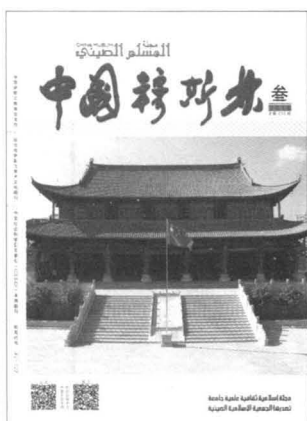
封面：云南建水县城区清真寺

本刊所付作者的稿酬包括纸质及数字形态出版的《中国穆斯林》杂志的稿酬。转载本刊文章及图片，须经作者或本刊同意。请尽量通过电子邮箱投稿，请勿一稿两投，来稿一律不退。