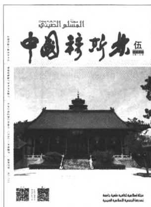
封面：山东台儿庄清真寺

本刊所付作者的稿酬包括纸质及数字形态出版的《中国穆斯林》杂志的稿酬。转载本刊文章及图片，须经作者或本刊同意。请尽量通过电子信箱投稿，请勿一稿两投，来稿一律不退。