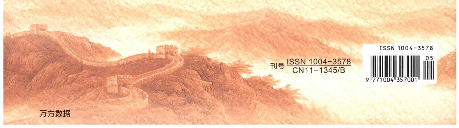
馬成麟 / 作

壽誕 慶祝中華人民共和國成立七十周年 歲次己亥年初月邊 北京 畫堂 畫人 馬成麟